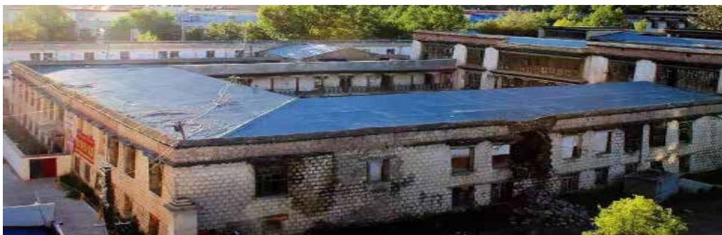
Wurde im Frühjahr 2018 abgerissen: Das Yabshi Taktser-Haus, die ehemalige Residenz der Eltern des Dalai Lama im Zentrum von Lhasa.