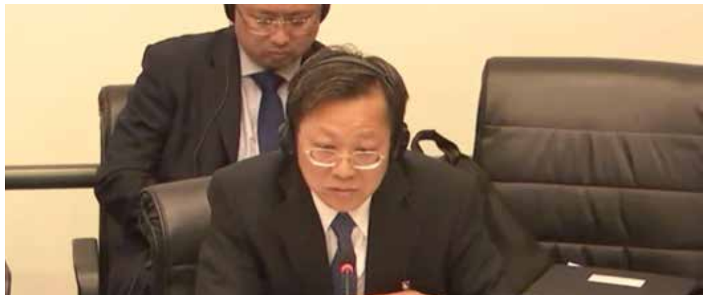
„Leugnen, Vernebeln, Irreführen“ - so präsentierten sich Pekings Vertreter vor dem Antirassismus-Ausschuss der UNO.

Beim Genfer UN-Ausschuss für die Beseitigung der Rassendiskriminierung (CERD) drehte sich Mitte August alles um die Lage in China. Das Bild, das die Vertreter Pekings dabei zeichneten, hatte jedoch wenig mit den Realitäten in Tibet und China zu tun. So gebe es keinerlei Diskriminierung in der Volksrepublik, und auch die Menschenrechte wür-