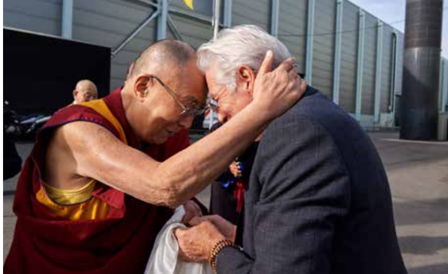
Inniger Moment: Der Dalai Lama und Richard Gere begrüßen sich.