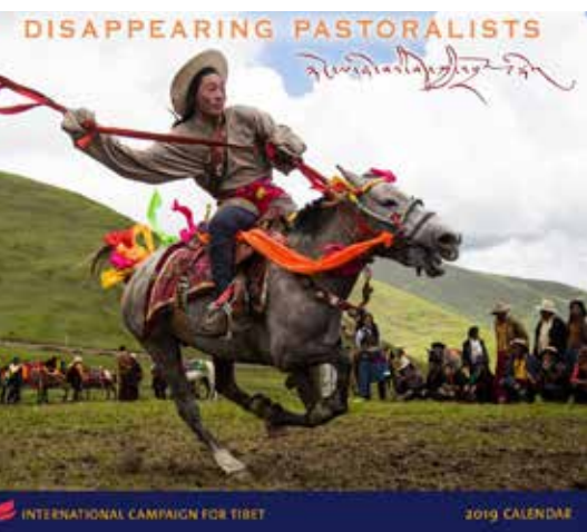
Der neue Tibet-Kalender 2019.

www.savetibet.de/tibetjournal/42/klartext