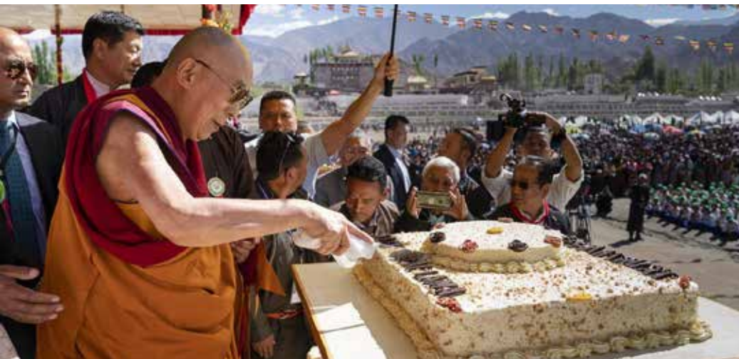
Zehntausende hatten sich in Leh versammelt, um mit dem Dalai Lama Geburtstag zu feiern.

die eklatanten menschenrechtspolitischen Defizite in China und Tibet hinweisen. ICT dankt allen Unterzeichnerinnen und Unterzeichnern der Petition! (mr)