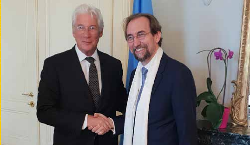
Am 26. Juni empfing der UN-Hochkommissar für Menschenrechte Zeid al Hussein in Genf den ICT-Vorsitzenden Richard Gere, um mit ihm über die Menschenrechtssituation in Tibet zu sprechen.