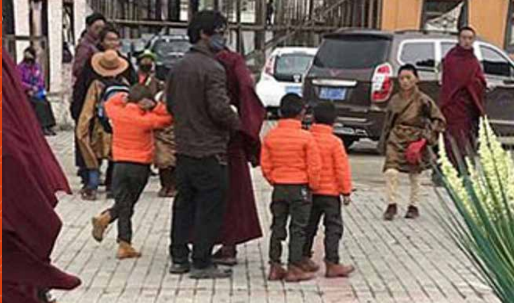
Junge Mönche werden aus dem Kloster Sershul weggeführt.