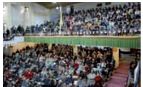
Tibeter bei der Sonderversammlung in Dharamsala.

Die Exilregierung begrüßte ferner Äußerungen von UN-Generalsekretär Ban Ki Moon, der am 12. Dezember 2008 die chi-