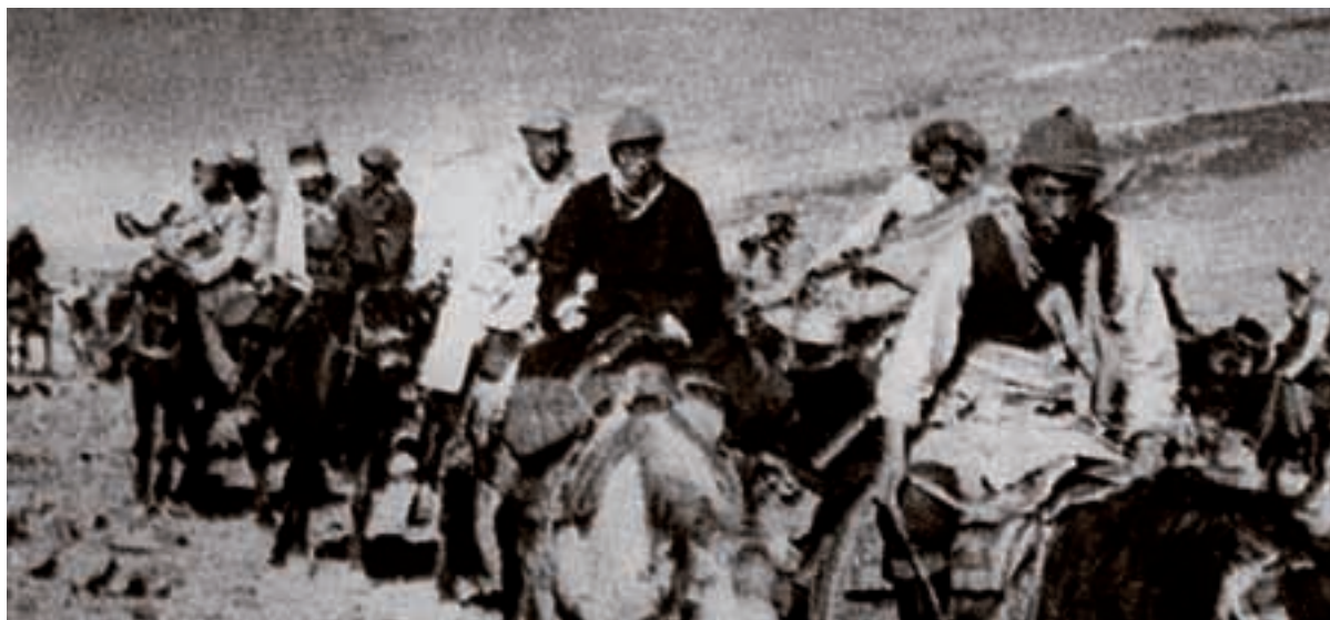
Der 14. Dalai Lama (Dritter von rechts) auf der Flucht ins indische Exil.