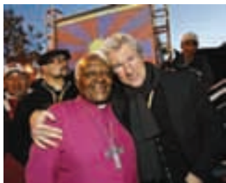
ICT-Fackellaufproteste: Richard Gere und ICT-Mitglied Desmond Tutu in San Francisco

Jintao in der Tibetfrage einzuwirken. / Der Sondergesandte des Dalai Lama bezeichnet erneut stattgefundenen Gespräche mit der chinesischen Seite als „schwierig“ und „enttäuschend“. / ICT unterstützt „Songs for Tibet“, mit dem Sting, Alanis Morissette, Jackson Browne, Suzanne Vega, Moby und viele andere Künstler ihre Unterstützung für den Dalai Lama ausdrücken. China blockiert