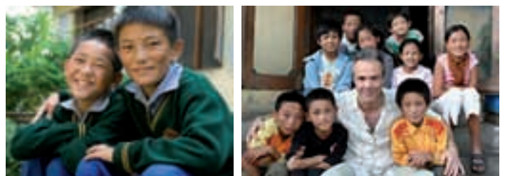
Links: Freuen sich über die Hilfe von ICT: tibetische Flüchtlingskinder in Suja. Rechts: Unterstützt das ICT-Projekt: Hannes Jaenicke.

Die Arbeiten im Kinderdorf von Suja in Nordindien gehen weiter. Die Fundamente für die ersten beiden großen Vorhaben, das neue Gesundheitszentrum und ein Gebäude mit Schlafsälen, Küchen und sanitären Anlagen konnten fertiggestellt werden, so dass voraussichtlich ab Herbst 2009 die ersten Kinder in das neue Gebäude einziehen und die ersten Patienten behandelt werden können. Mit dem Projekt im überfüllten tibetischen Kinderdorf von Suja will ICT die prekäre Situation der tibetischen Flüchtlingskinder verbessern. Das Gesamtprojekt hatte 2007 am RTL-Spendenmarathon teilgenommen und wird voraussichtlich bis 2013 abgeschlossen sein. Prominenter Unterstützer und Projektpate ist der Schauspieler Hannes Jaenicke.