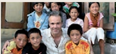
Unterstützt das ICT-Projekt: Hannes Jaenicke.

Unter den vielen tibetischen Flüchtlingen, die Jahr für Jahr aus Tibet über den Himalaja ins indische und nepalesische Exil fliehen, befinden sich zahlreiche Kinder und Jugendliche. Die Flüchtlingsheime sind häufig massiv überbelegt und die medizinische Versorgung ist oftmals unzureichend. Im Jahr 2007 nahm ICT mit einem Hilfsprojekt für das Kinderdorf in Suja, Nordindien, erfolgreich am RTL-Spendenmarathon teil. Bereits 2008 konnten die ersten Baumaßnahmen beginnen. Unser Projektpate ist der bekannte deutsche Schauspieler Hannes Jaenicke, der das Projekt mitinitiiert hat. Damit wir unsere Hilfe für tibetische Flüchtlingskinder intensivieren können, sind wir auf weitere Unterstützung angewiesen