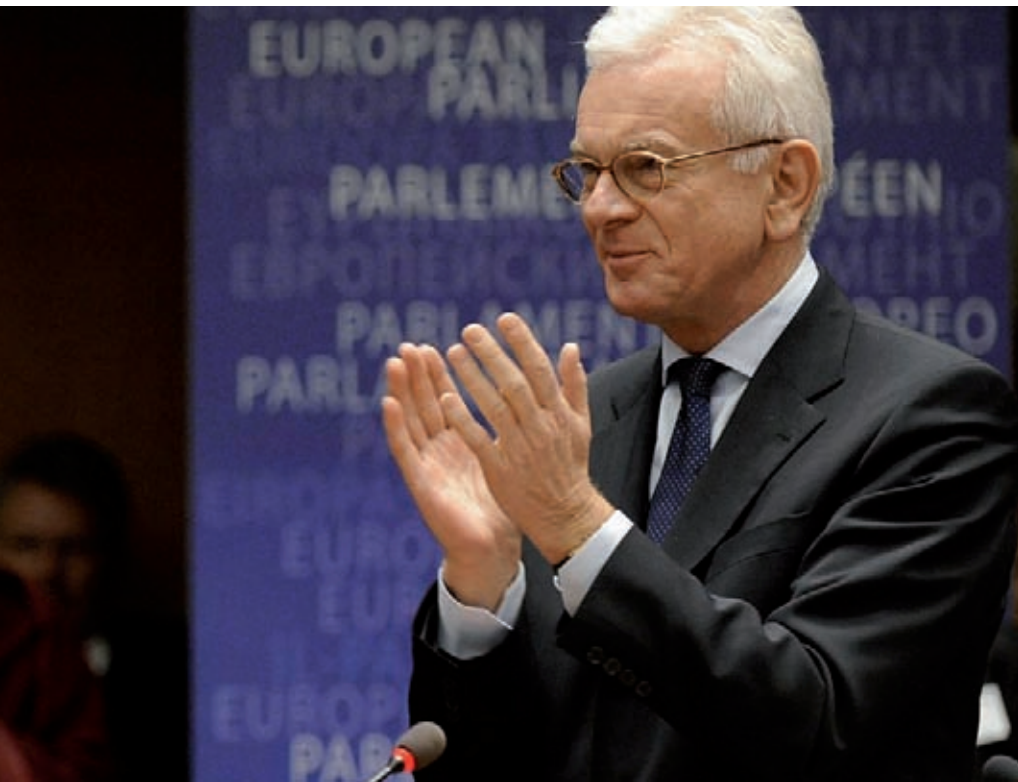
Der europäische Parlamentspräsident Hans-Gert Pöttering (rechts) begrüßt den Dalai Lama am 4. Dezember 2008 im EU-Parlament in Brüssel.

lichen – ganz egal: Für die chinesische Führung scheint es nie zu genügen. Pekings Botschafter in den Niederlanden brachte kürzlich die chinesische Politik auf den Punkt. In einem Zeitungsinterview sagte Botschafter Zhang Jun „Wir sind gegen jeden Besuch des Dalai Lama in jedem Land. Und wir sind gegen jedes Treffen des Dalai Lama mit jedem Politiker in jedem Land.“