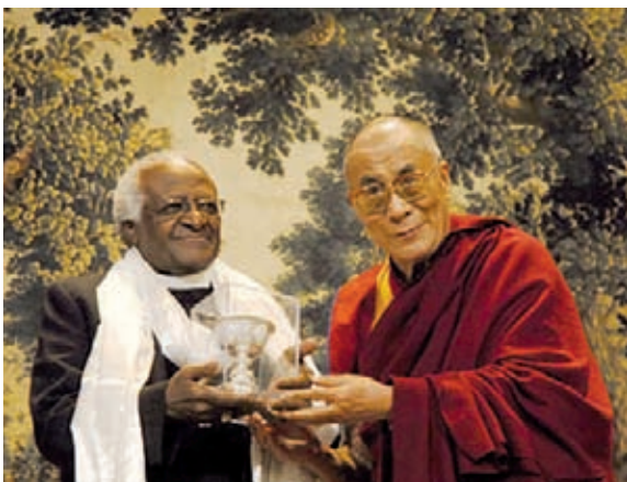
Unterstützt den Dalai Lama: Erzbischof Desmond Tutu, Friedensnobelpreisträger und Mitglied des Internationalen Beirats von ICT.

Die Proteste blieben nicht ohne Wirkung, die neue Regierung Südafrikas hat inzwischen eine radikale Kehrtwende vollzogen. Am 14. Mai sagte Maite Nkoane-Mashabaneshe, Südafrikas Ministerin für Internationale Beziehungen und Zusammenarbeit, „Wie jedem anderen Bürger dieses Planeten auch, steht es dem Dalai Lama frei, unser Land zu besuchen.“ Man habe die Angelegenheit im März nicht „klar kommuniziert“, sagte die Ministerin. Offiziell war die verweigerte Visumserteilung damit begründet worden, der Besuch des Dalai Lama bedeute eine Störung der Vorbereitungen auf die Fußball-Weltmeisterschaft in Südafrika im kommenden Jahr. Dahingegen ist der vom Internationalen Strafgerichtshof in Den Haag per Haftbefehl gesuchte sudanesischer Staatspräsident Omar Al-Baschir offenbar weniger störend. Er war ganz offiziell zur Amtseinführung von Südafrikas neuem Präsidenten Jacob Zuma eingeladen worden, blieb den Feierlichkeiten jedoch aus Angst vor einer Verhaftung fern. (mr)