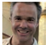
Hannes Jaenicke

„Missing Voices“ heißt die Kampagne der ICT, die den Tibetern eine Stimme verleiht, die sich selbst nicht mitteilen können, weil sie hinter chinesischen Gefängnismauern in Haft gehalten werden, weil sie „verschwunden“ oder vielleicht nicht mehr am Leben sind. Ihre Zahl wird derzeit auf etwa 1200 geschätzt. Seinen Teil zum Gelingen dieser Aktion beigetragen hat der Schauspieler Hannes Jaenicke. Seit kurzem steht auch sein Statement auf: www.missingvoices.net . Bitte geben auch Sie den politischen Gefangenen in Tibet eine Stimme!