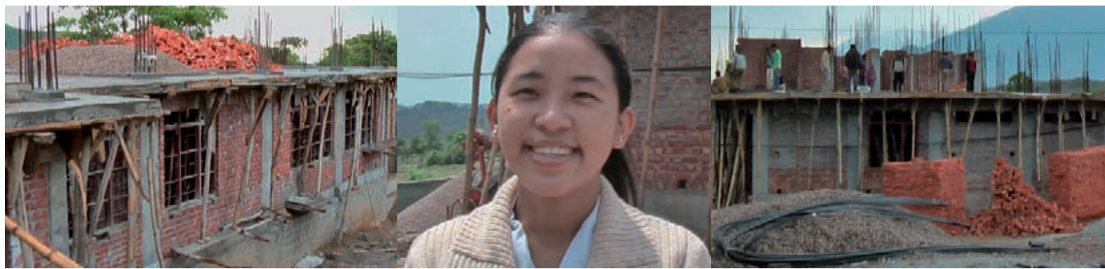
Von links nach rechts: zusätzliche Unterkunft für Kinder; Krankenschwester in Suja; neues Gesundheitszentrum