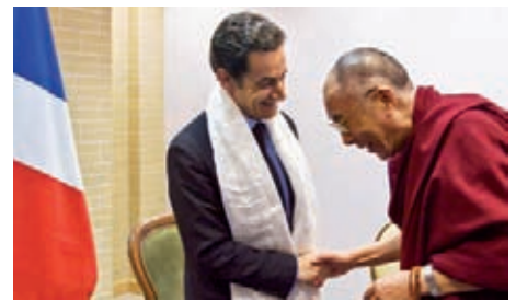
Der französische Staatspräsident Nicolas Sarkozy begrüßt während seiner sechsmonatigen EU-Ratspräsidentschaft den Dalai Lama am 6. Dezember 2008 in Danzig.

Freund der KP-Führung Milliardenaufträge für die französische Wirtschaft zu sichern. Offenbar zum Wohlgefallen Pekings hatte Sarkozy sich bemüht, „kritische Themen“ wie den Schutz der Menschenrechte niedrig zu hängen. Tibet war kein Thema. Ein ganz anderes Bild Anfang 2009: Da meidet Premier Wen Jiabao bei seiner Europareise ganz demonstrativ Frankreich, nachdem sich Sarkozy im Dezember 2008 mit dem Dalai Lama getroffen hatte. Empfangen wird der chinesische Premier stattdessen auch in Berlin, das für ihn und seine ungewöhnlich große Wirtschaftsdelegation den roten Teppich ausgerollt hat. In den Hauptstädten Europas wartet man indes vergebens auf Solidaritätsadressen an Paris. Froh ist man, dass sich China in Zeiten der globalen Wirtschaftskrise überhaupt die Ehre gibt, so scheint es. Dass Kanzlerin