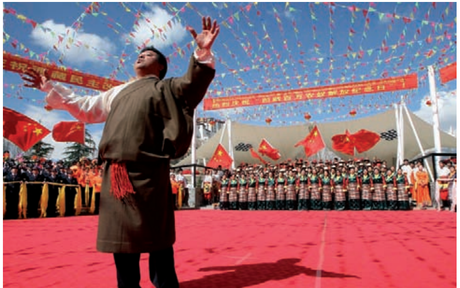
Bestellter Jubel in Lhasa: Ein Tibeter preist die Politik der Kommunistischen Partei Chinas.

Vorausgegangen war dem Ganzen eine wochenlange Propagandaschlacht in den chinesischen Staatsmedien. Frei nach dem Motto des Wahrheitsministeriums in George Orwells 1984, „Wer die Vergangenheit beherrscht, beherrscht die Zukunft; wer die Gegenwart beherrscht, beherrscht die Vergangenheit“ macht die Regierung in Peking deutlich, dass sie auch im Hinblick auf die tibetische Geschichte die alleinige Definitionsmacht für sich beansprucht. Die Erinnerung an den blutig niedergeschlagenen Volksaufstand vom 10. März 1959 soll so durch einen neuen verpflichtenden Geschichtsnarrativ verdrängt werden. Dieser lautet kurz zusammengefasst so: Die Volksrepublik China hat vor 50 Jahren unhaltbare gesellschaftliche Zustände beendet, hat Menschen vom Mittelalter in eine lichte Gegenwart katapultiert. Chinas Medien heben die „Befreiung von der Leibeigenschaft“ gar auf eine Stufe mit der Befreiung der afroamerikanischen Sklaven durch Abraham Lincoln während des amerikanischen Bürgerkriegs. Tatsächlich aber markierte der 28. März 1959 das vorläufige Ende des tibetischen Volksaufstands, der am 10. März begonnen hatte. In seinem Verlauf verloren mehrere zehntausend Tibeter ihr Leben, der Dalai Lama musste – begleitet von zahlreichen Flüchtlingen