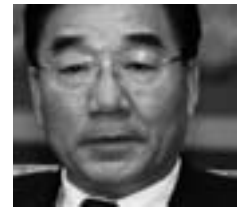
Steht auf der Liste der Vorgeladenen: Parteisekretär Zhang Qingli.

Nach dem „Weltrechtsprinzip“ können im Falle von Verbrechen gegen die Menschlichkeit alle Staaten juristisch tätig werden, auch wenn es – wie im vorliegenden Fall – keine direkte Verbin-