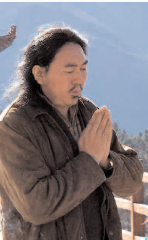
Karma Samdrup, tibetischer Umweltaktivist