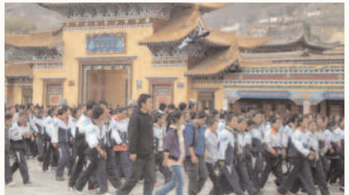
Tibetische Schulkinder protestierten gegen die Abschaffung des Tibetischen aus dem Unterricht.

Die Ehefrau des inhaftierten Tibeters Dhondup Wangchen, Lhamo Tso, ist zu Gast in Berlin • Der tibetische Intellektuelle Tragyal wird aus der Haft entlassen, das Verfahren gegen ihn läuft aber weiter • In der Provinz Qinghai gehen tausende tibetische Schüler auf die Straße und protestieren gegen die Abschaffung des Tibetischen als Unterrichtssprache • Das Nobelkomitee in Oslo gibt bekannt, dass der chinesische Intellektuelle Liu Xiaobo, Verfasser der „Charta 08“, mit dem diesjährigen Friedensnobelpreis ausgezeichnet wird • Die Vorwahlen zum tibetischen Exilparlament und zum Exil-Premierminister werden in Nepal überschattet von der Beschlagnahme von Wahlurnen durch die nepalesische Polizei • ICT startet eine Kampagne für Meinungsfreiheit in Tibet, mit der Bitte an Außenminister Westerwelle, sich für inhaftierte Tibeter einzusetzen.