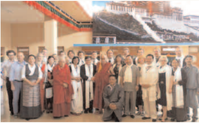
Das Internationale Parlamentariernetzwerk zu Tibet trifft den Dalai Lama.