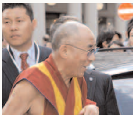
Der Dalai Lama feierte seinen 75. Geburtstag.

Der Dalai Lama zum Jahrestag des tibetischen Volksaufstandes: „Die Wahrheit wird sich durchsetzen“ • Überall in Tibet wird der Proteste in 2008 gedacht, Augenzeugen beschreiben Lhasa ob der Sicherheitsmaßnahmen in der Stadt „wie in einer Kriegszone“.