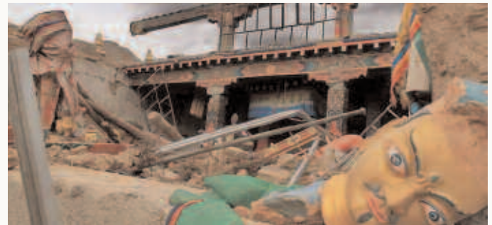
Zerstörung: Nach dem Erdbeben in Tibet.