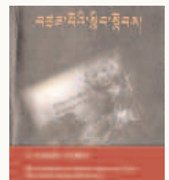
Bild oben: ICT-Bericht über tibetische Intellektuelle. Bild unten: Neu konstituiert: Der Tibet-Gesprächskreis im Deutschen Bundestag.