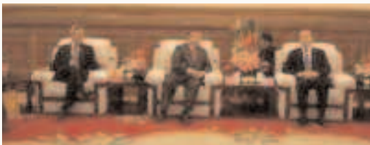
Gespräche zwischen den Gesandten des Dalai Lama und der chinesischen Staatsführung.

Die Urteile gegen Dhondup Wangchen und den angesehenen Lama Phurbu Rinpoche werden bekannt • Außenminister Westerwelle reist nach China, ICT fordert: Tibet muss auf der Agenda stehen • Erneut finden Gespräche zwischen Gesandten des Dalai Lama und der chinesischen Führung statt • In Peking hatte zuvor das einflussreiche „Tibet-Arbeitsforum“ getagt, auf dem verstärkte Entwicklungsbemühungen in Tibet angekündigt werden: Anlass zur Hoffnung oder Fortführung alter Politik mit neuer Verpackung?