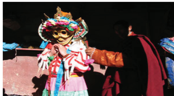
Ein tibetischer Cham-Tänzer während einer rituellen Beschwörung von buddhistischen Schutzgöttern.

Die Vorschriften seien bemerkenswert, weil sie im Detail das Prozedere der Anerkennung einer Reinkarnation regeln wollen, was seit Jahrhunderten