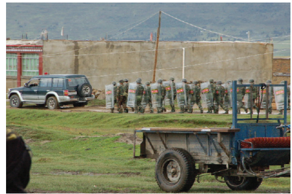
Chinesische Sicherheitskräfte in Lithang.