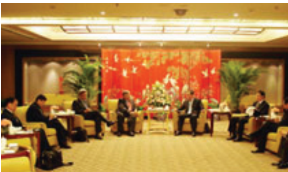
Die sechste Gesprächsrunde zwischen Tibetern und Chinesen fand in Shanghai und Nanjing statt.