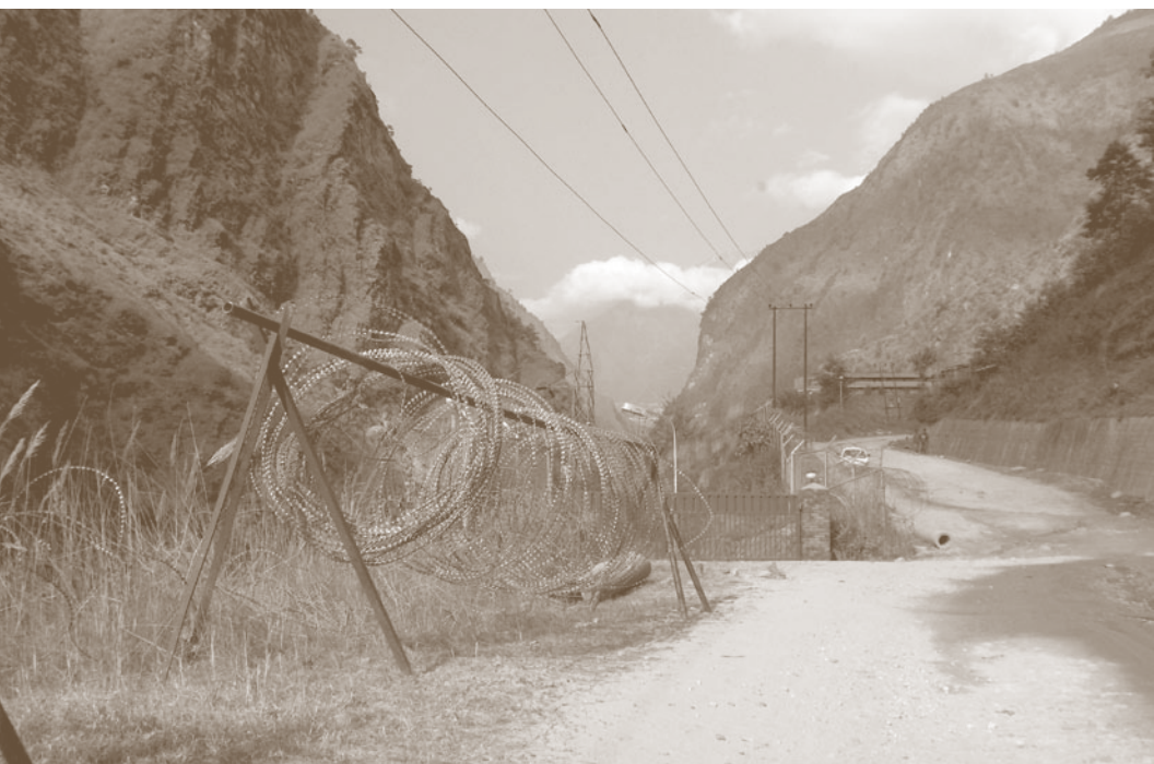
Stacheldraht in der Nähe des Grenzübergangs an der nepalesisch-chinesischen "Freundschaftsbrücke".

Die maoistischen Rebellen sind gut organisiert und man schätzt, dass ihnen 10.000 bis 15.000 Kämpfer zur Verfügung stehen. Viele Beobachter halten Nepal für ein gescheitertes Land und die Herrschaft von König Gyanendra in wirtschaftlicher und menschenrechtlicher Hinsicht für verheerend. Aufgrund der unberechenbaren politischen Lage, schlechter Sicherheitsbedingungen und der labilen Regierungssituation sind tibetische Flüchtlinge, die von