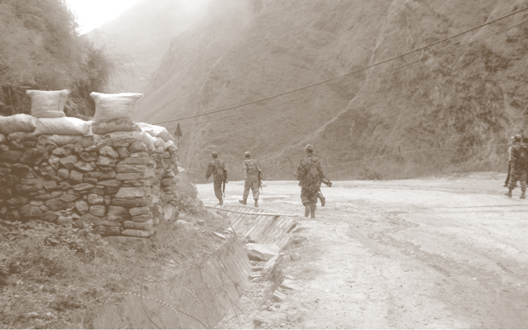
Soldaten der königlich nepalesischen Armee an einem Grenzübergang.