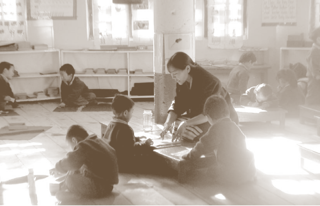
Kinder und ein Lehrer in ihrem Klassenzimmer im tibetischen Flüchtlingshilfswerk in Katmandu.

der kulturellen und religiösen Vielfalt wie auch der Ausübung politischer Freiheiten nicht leicht vereinbar. Die ökonomischen Leitlinien wurden von oberster Regierungsstelle festgelegt und gehen nicht auf lokale Bedürfnisse ein. Sie spiegeln die Prioritäten der Zentralregierung und nicht der tibetischen Bevölkerung wider.