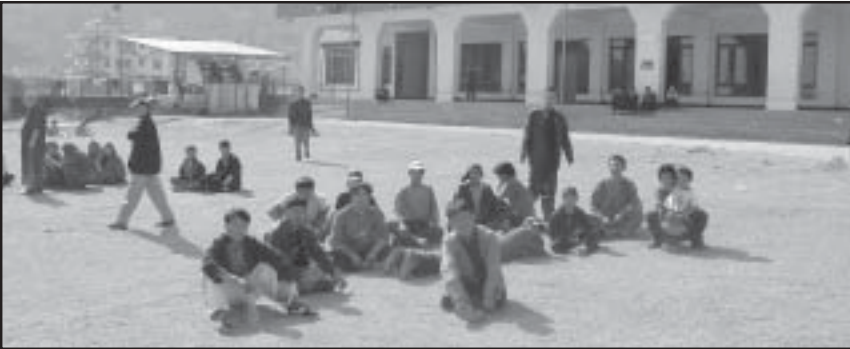
Unten: Flüchtlinge warten im UNHCR Tibetan Refugee Transit Center in Kathmandu auf die sichere Weiterreise nach Indien.

Im Mai 2001 begann das TRTC, zeitlich begrenzt gültige Reisepapiere für Tibeter auf der Durchreise auszustellen. Obwohl das UNHCR den begrenzten Schutz vor Inhaftierung, den diese Papiere bieten konnten, schätzte, war es nicht gewillt, die Papiere unter seiner Federführung auszustellen. Genausowenig war das nepalesische Innenministerium dazu zu bewegen, eine Aussage über die Zweckmäßigkeit oder den Nutzen des Ausweises zu treffen. Der Ausweis, versehen mit einem Foto des Inhabers, bescheinigt auf Englisch, Nepalesisch, Hindi und Tibetisch, dass er oder sie für das UNHCR eine „gefährdete Person“ darstellt. Sobald ein Flüchtling Dharamsala, in Indien, erreicht, wird sein Pass zu den Akten gelegt. Sollte der Inhaber jemals wieder nach Tibet zurückkehren wollen, kann er seine Karte für die endgültige Übergabe an das TRTC in Kathmandu zurückfordern. Es werden einige Geschichten erzählt, in denen tibetische Rückkehrer der Inhaftierung in Nepal durch das Vorzeigen der Papiere entrinnen konnten. Das UNHCR war nicht in der Lage, sich über die Wirksamkeit dieses neuen Systems zu äußern. Tibetische Beamte in Kathmandu und Dharamsala deuteten an, dass das System reibungslos funktioniere. 13