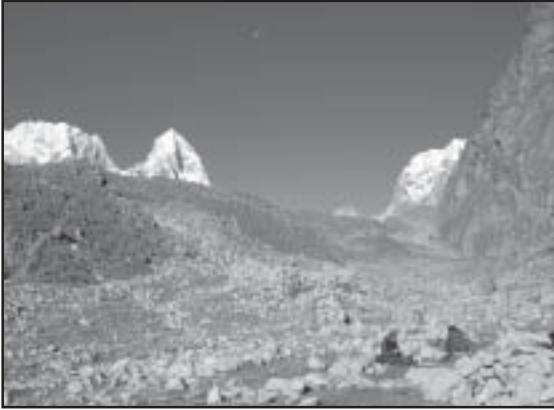
Ein Menschenrechtsbeobachter der ICT reist entlang der Route, der tibetische Flüchtlinge aus Tibet nach Nepal folgen.