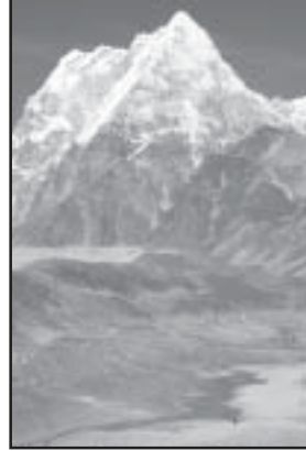
Die Überquerung dieser offenen Hochebene zwei Tagesreisen von Tibet entfernt ist bei gutem Wetter einfach, kann jedoch bei 30 cm Neuschnee zu einer heimtückischen Falle werden.

Der Xinhua Bericht versucht, ein sympathisches Bild der chinesischen Aktivitäten in der Region des Nangpa-la Passes zu vermitteln: