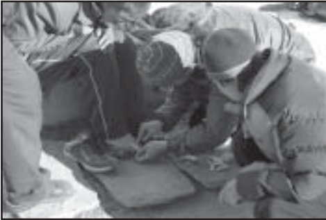
Ein Freiwilliger der ICT stellt in einer Hütte in 4.800 Metern Höhe in Nepal erste Hilfe. Überanstrengung, Wassermangel und Erfrierungen sind bei den Flüchtlingen auf dieser Route häufig zu beobachten.

Die Nachricht von verstärkten chinesischen Grenzkontrollen erreichte auch die Bergführer, die tibetische Flüchtlinge begleiten, so dass im Jahre 2002 eine wachsende Anzahl Flüchtlinge – manchmal nach einer Pilgerfahrt zum Berg Kailash – die Routen weiter nördlich wählten, die in dem Gebiet von Mustang nach Nepal münden. 4 Es gab auch Berichte, nach denen tibetische Flüchtlinge direkt über die tibetisch-indische Grenze nach Indien gekommen seien. 5