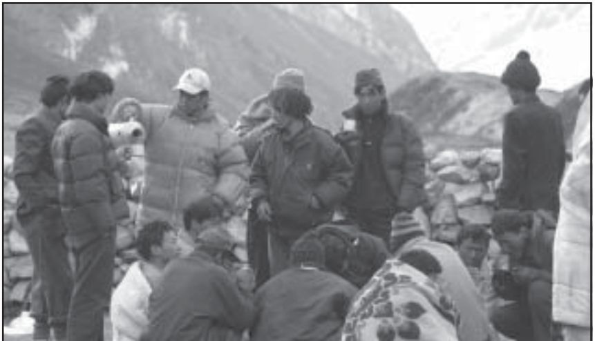
Ein Sherpa gießt einer Gruppe tibetischer Flüchtlinge auf der historischen Handelsroute zwischen Tingri in Tibet und Namche Bazaar in Nepal Tee ein.