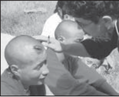
Links: Ein tibetischer Menschenrechtsbeobachter untersucht die Kopfwunde eines Mönchs aus Osttibet. Er erlitt den Hieb, als maoistische Rebellen versuchten, von der Gruppe Wegezoll zu erpressen. 09/02