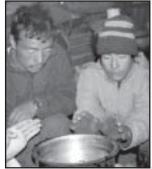
Erschöpfte Flüchtlinge warten in einer Höhe von 4.500 Metern Höhe auf Tee.