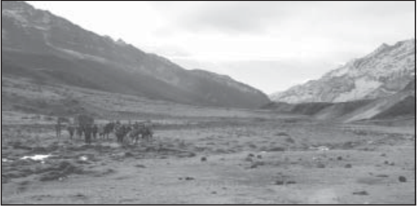
Flüchtlinge auf ihrem Weg vom Nangpa-la Pass zum Fuße des Himalaya in Nepal.

Im Jahr 1991 eröffnete das UNHCR ein Büro in Kathmandu und begann damit, Tibeter, die aus Tibet geflohen waren, als „bedrohte Personen“ zu registrieren. Seither wurden jährlich im Durchschnitt 2.500 Tibeter registriert, die das UNHCR um Schutz baten, wobei diese Zahl in einzelnen Jahren weit überschritten wurde. Die Gründe, aus denen Tibeter ihre Heimat verlassen, sind unterschiedlich. Sie können so einfach sein wie der Wunsch, den Dalai Lama zu sehen und so komplex wie das Leben in Tibets moderner Gesellschaft, in welcher der chinesische Einfluss die tibetische Identität zu verdrängen droht und in der grundlegende Freiheitsrechte verwehrt werden.