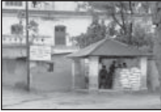
Dili Bazaar Gefängnis, Kathmandu Hauptgefängnis, in dem tibetische Flüchtlinge festgehalten werden.

der sie untersuchte, diagnostizierte bei der Mutter zusätzlich zu ihrem geschwächten körperlichen Zustand Typhus. In Anbetracht ihrer ersten gesundheitlichen Lage organisierte der Arzt den Geldbetrag, um ihre Reststrafe von 121.897 nepalesischen Rupees (€1780) zu bezahlen.