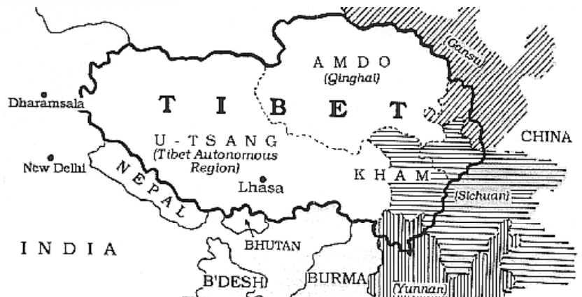
Karte 2: Das historische Tibet. Diese Karte zeigt die drei traditionellen Provinzen Tibet vor 1951 und wie durch die chinesischen Provinzen der Volksrepublik China geteilt waren: Amdo (fast vollständig Qinghai und Teile von Gansu und Sechuan), Kham (Teile von Sechuan, Yunnan und Qinghai und die Tibetisch Autonome Region) und U-Tsang (fast vollständig Tibetisch Autonome Region).